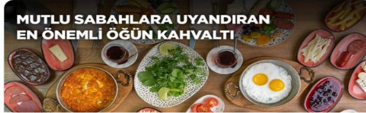
T.C. Frankfurt BK @TCFrankfurtBK

İlk ve en önemli enerji kaynağımız olan kahvaltıyı hatırlamak için güzel bir gün olan #DünyaKahvaltıGünü kutlu olsun!