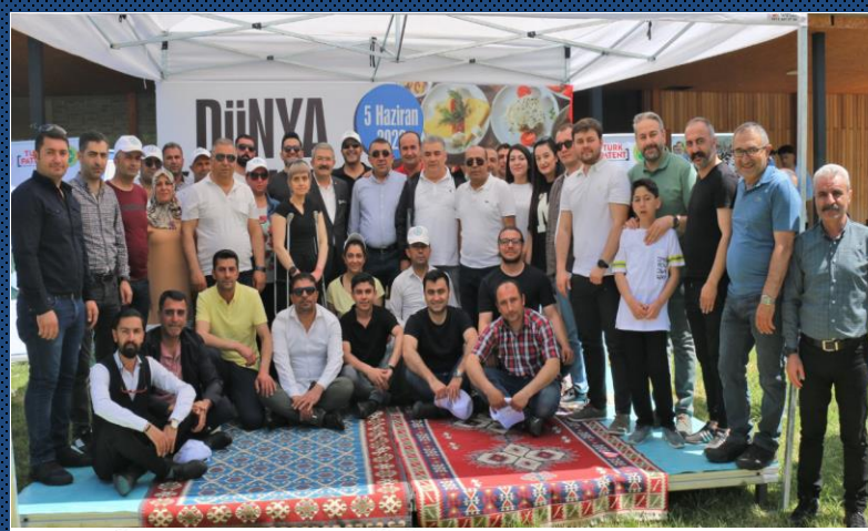
İstanbul Ticaret Borsası - İSTİB @istib1924

Dünya Kahvaltı Günü'nün 3.'sü Türkiye ve Dünyanın birçok noktasında kutlandı.