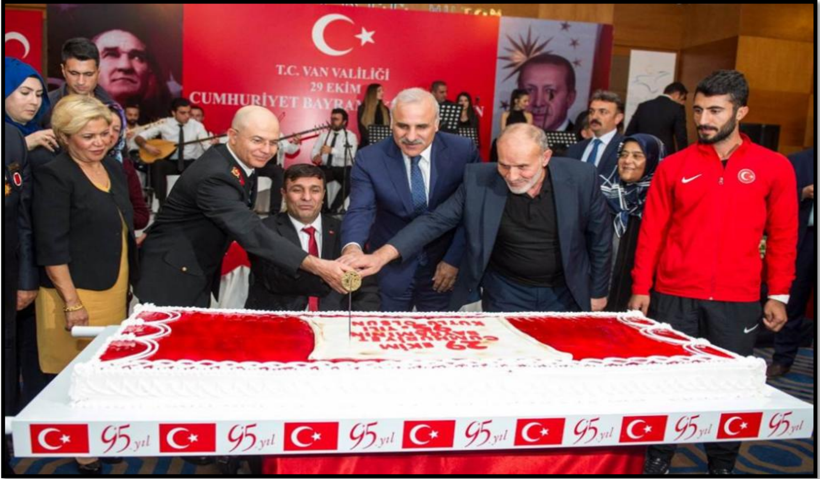
29 Ekim Cumhuriyet Bayramı Kutlamalarına Katılım Sağlandı.