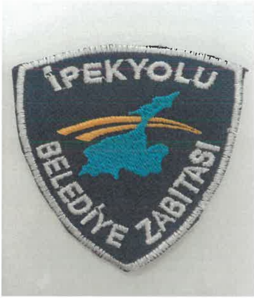
ŞEKİL 5 ( Belediye kol tanıtım Arması)