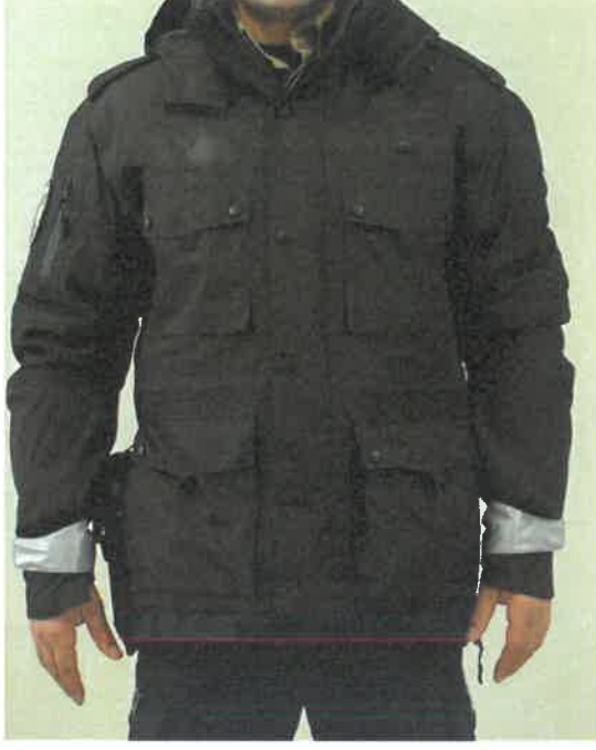
ŞEKİL 8 (Zabıta parka lacivert renkte)