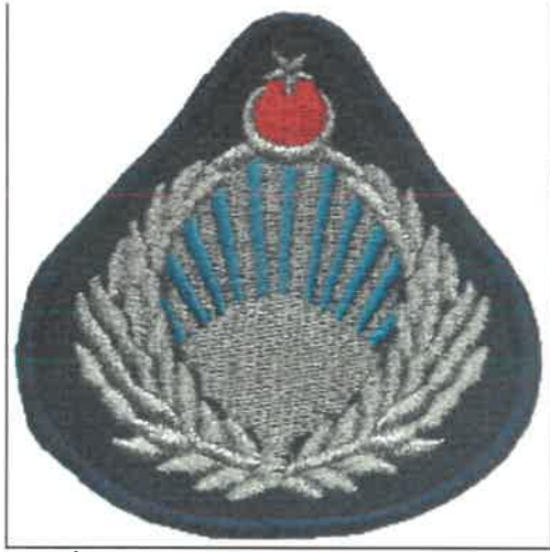
ŞEKİL- 1 (Zabıta Kokardı bere için)

e) Apolet (Şekil- 10): Ceket, palto, pardösü ve yazlık gömleğin omuzlarında bulunur. Apolet, giyilen eşyanın kumaşından yapılır. Bir kat tela konmuş iki kat kumaştan ve takriben onyediy santimetre uzunluğunda olup, omuz başlarına kol dikişleri ile dikilir. Üst yaka dikişine kadar devam eder ve yaka kenarı ile temaslı olarak dikilen düğmeye iliklenir. Apoletin genişliği omuz başlarında altı santimetre ve omuz nihayetine gelen düğme hizasına dört santimetredir. Ucu yuvarlaktır. Tek kanat rütbe işareti takan zabıta memuru bu apoleti kullanır, müdüre kadar olan rütbedeki personelin apolet kenarları 3 milimetre kalınlığında gümüş sim işlemeli, zabıta şube müdürü ve zabıta müdürleri çift sıra sırmalı apolet, zabıta daire başkanının taktığı apoletlerin kenarında ise üç sıra gümüş sim işleme bulunur. Apoletlerin omuz uç kısmındaki geniş olan yerde metal üzerine yazılmış personelin sicil numarası bulunur.