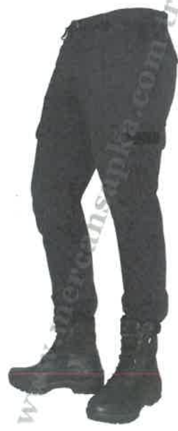
ŞEKİL 9 (Zabıta pantolon ve bot)