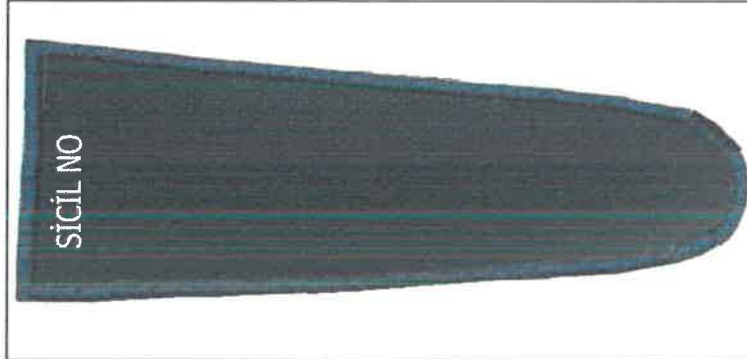
Memur Apoleti ( Kenar İşlemesi Elbise Kumaşı İpliğinden )