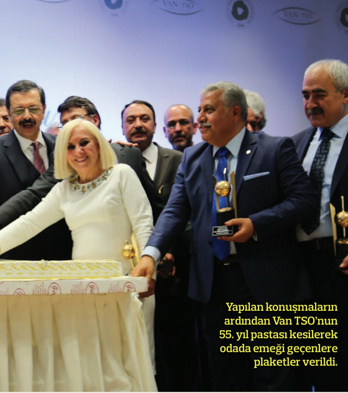
Yapılan konuşmaların ardından Van TSO'nun 55. yıl pastası kesilerek odada emeği geçenlere plaketler verildi.