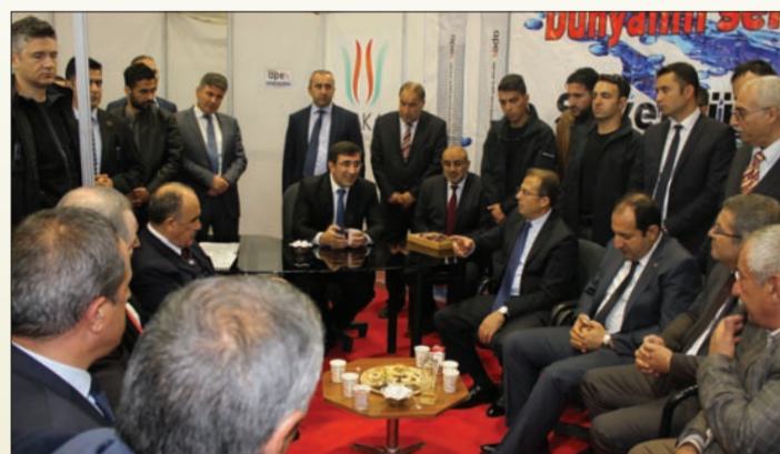
Van'da İran İhracat Zirvesi düzenlendi.

Van'da İran İhracat Zirvesi düzenlendi. Düzenlenen zirvede Türkiye-İran ilişkilerinde Van'ın önemine vurgu yapıldı.