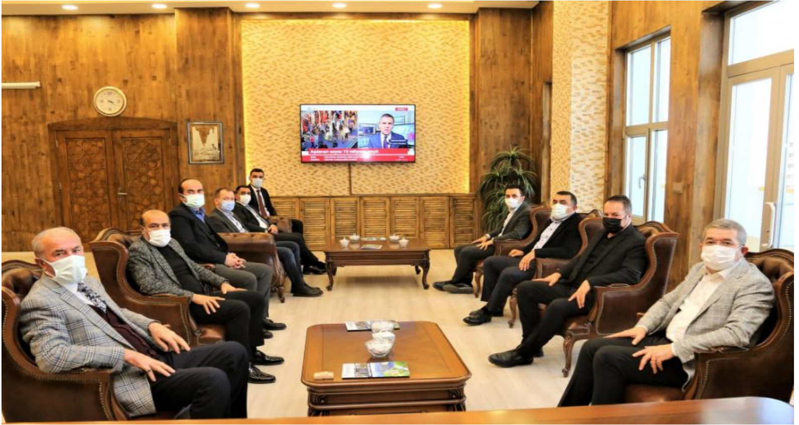
Yönetim Kurulumuz, Tuşba Belediye Başkanı Salih Akman'a nezaket ziyaretinde bulundular.