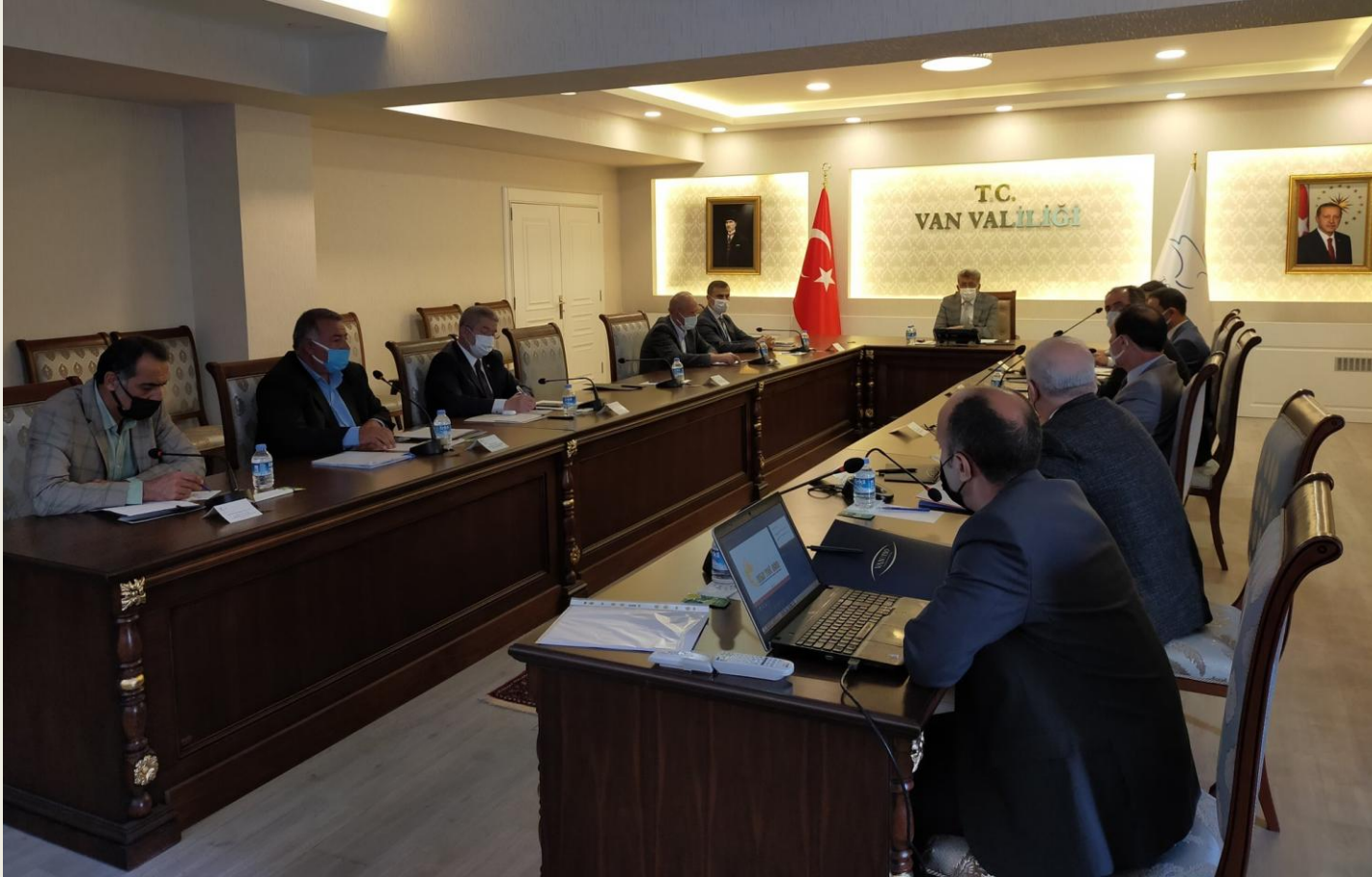
Van Tarıma Dayalı İhtisas Besi Organize Sanayi Bölgesi "Müteşebbis Heyet Kuruluş Protokol Toplantısı" yapıldı.