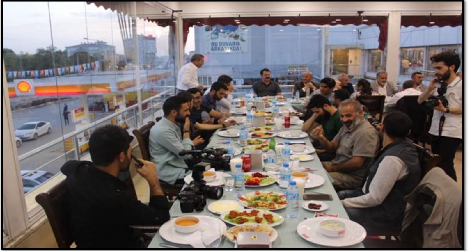
Basın mensupları ile iftar programında bir araya gelindi.