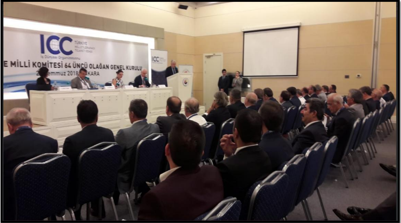
Milletlerarası Ticaret Odası (ICC) 64. Olağan Genel Kurulu'na Katılım Sağlandı.